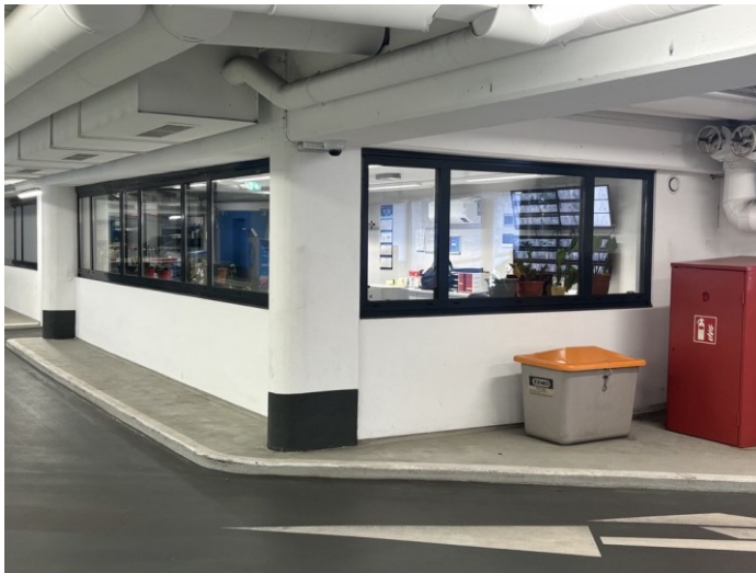
Ansicht außen (zu reinigendes Innenglas)

Im Zuge der Objektbegehung können die Begebenheiten vor Ort besichtigt werden.