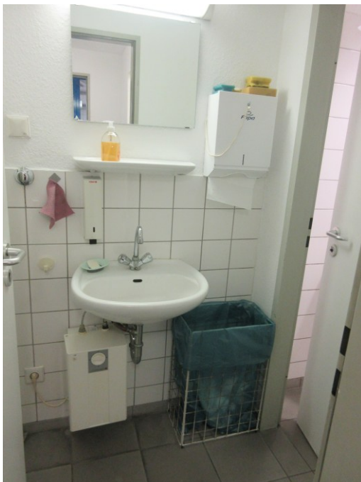
Sanitärräume der Garagenwarte (zumeist ebenfalls angrenzen/innenliegend im Garagenwartraum) P2 Dr. Ruer Platz