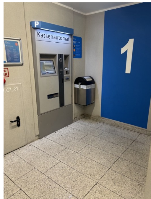
P1 Husemannplatz Treppenhaus 1