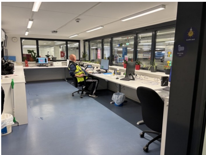
Ansicht innen - P1 Husemannplatz