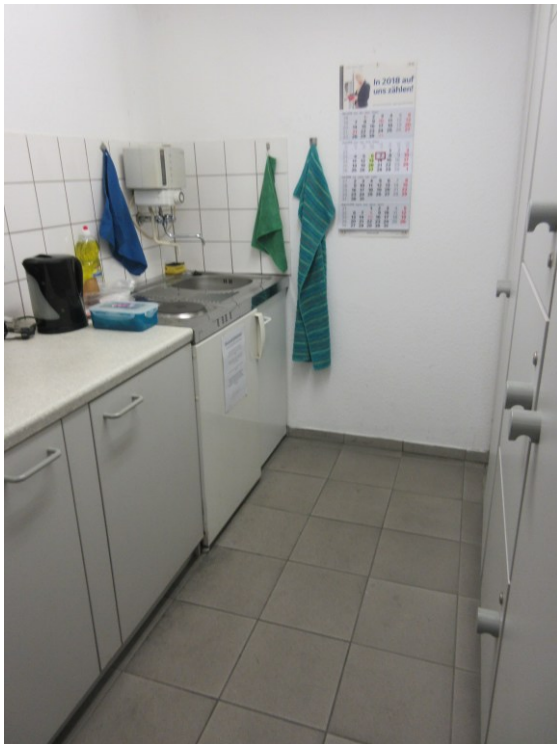
Teeküchen (innerhalb Garagenwartraum) P2 Dr. Ruer Platz