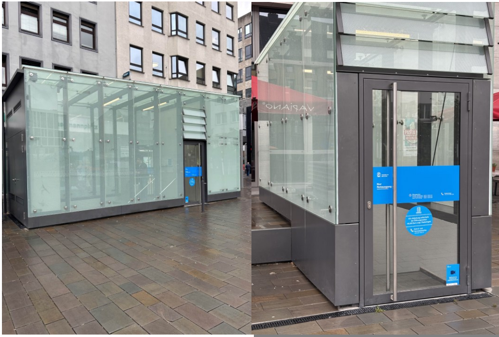
P1 TH1 Ausgang Kortumstr.