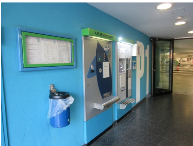
Verkehrsfläche mit integrierten Kassenautomaten P8 Konrad-Adenauer-Platz