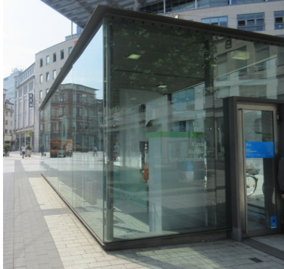
Parkhaus Massenberg Treppenhaus Schützenbahn inkl. Aufzug – Ein hoher Verbau an Glasflächen ist in den Parkhäusern üblich